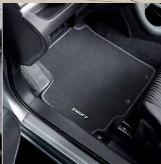
25 | Sada textilních podlahových rohoží DLX velur, s logem Swift, antracitová, 4dílná, pro levostranné řízení.