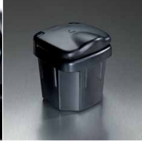
4 | Popelník Obj. čís. 89810-86G10-5PK