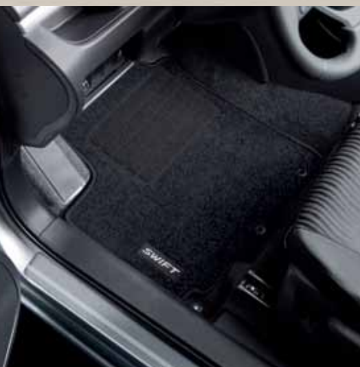
24 | Sada textilních podlahových rohoží ECO plstěná, s logem Swift, antracitová, 4dílná, pro levostranné řízení.