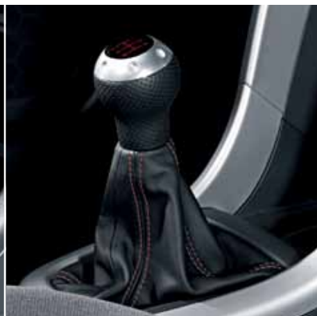
6 | Hlavice řadící páky kulatá včetně kožené manžety, se stříbrným prošíáním. Obj. čís. 990E0-68L37-000