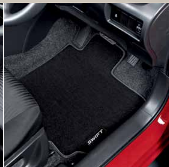
26 | Sada textilních podlahových rohoží DLX velur, s logem Swift, antracitová, 4dílná, pro pravostranné řízení.