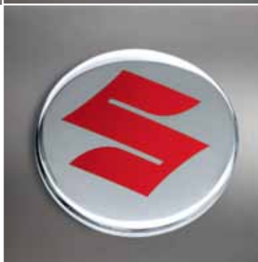
21 | Středová krytka „Red“ červené S na leštěném podkladu, pouze pro AL disk „Chrono“.