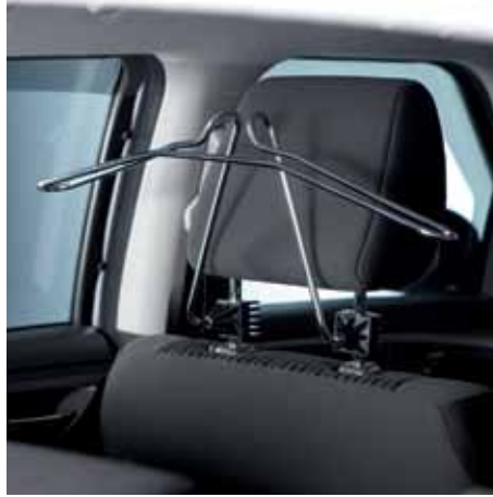
3 | Ramínko na šaty k uchycení na předních opěrkách hlavy, 1 kus. Obj. čís. 990E0-79J89-000